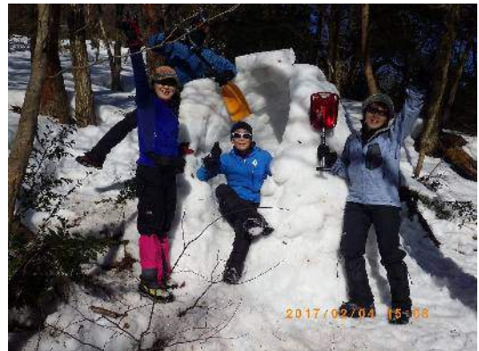
もうすぐ出来上り