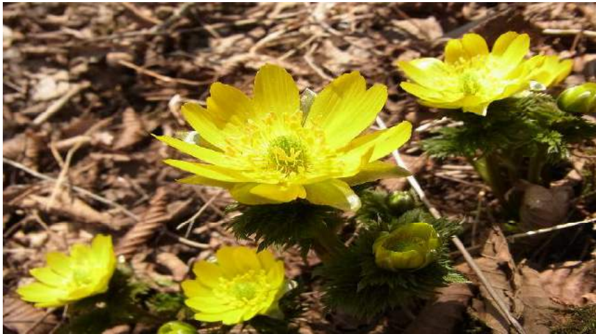
藤原岳にて「暖かく福寿草」 2016.03.27 撮影