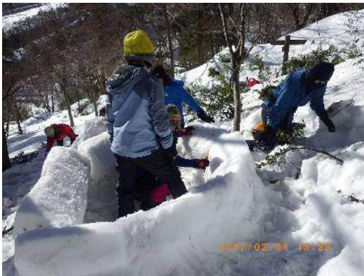
ブロックを積んで

参加した受講生はいずれもイグルー初体験でしたが、今回の講習を通じてイグルーに関する理解が深まったようです。イグルー作りを体験したい方は秋田（090-3727-3721）までご連絡ください。日程を相談して講習させていただきます。