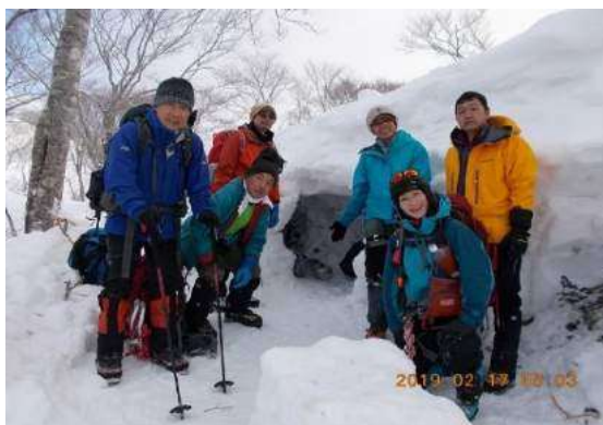
雪洞訓練、奥美濃・大日ヶ岳