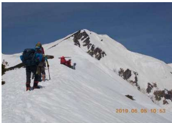
北アルプス・爺ヶ岳東尾根