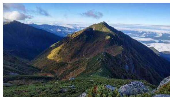
端正な山容の三ノ沢岳

翌日は分岐まで登り返し、余分な荷物をデポして宝剣岳に向かった。前回この稜線を歩いたのは20年以上も前のことだ。その時分は鎖などなく不安定な縦走路だったと記憶していたが、今は安定した岩場に直線的なルートが拓かれ鎖も随所に設置され安全になっていた。木曾駒側からのルートと合流する山頂直下で20分ほど順番を待ち狭い頂上に立った。