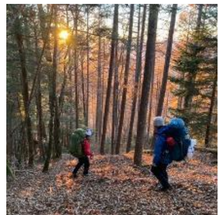
夕陽が木の葉を照らす。まだまだ下りるよー。