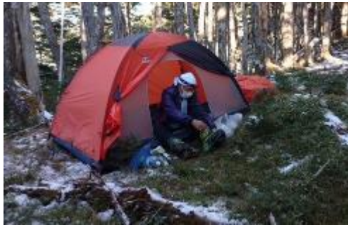
2 テンに 3 人。狭いくらいが調度良い。

雪が降った様だ。しかし寒さは左程厳しくなく、温かいお餅入り味噌汁を食べて出発。まずは鶏冠山を目指す。なかなかの急登と倒木に阻まれ、1 時間 20 分かかって到着。ここから先、写真で見た景色に入っていく。笹の平は広々とした開けた稜線だ。風を避けられる地点に、テントを張ったであろう場所が見える。池口岳に向かう稜線上で雪が本格的についてくる。近づくにつれ、傾斜もきつくなる。池口岳南峰分岐にくるが、迷わずパス。池口岳山頂は「やったー！」感はなく、その先のラクダのこぶの様に連なるピークに「へえ？」となる。11:20 長い下山が始まる。傾斜がきつく、バックステップで下りる。アップダウンが続きなかなか水平キョリが稼げない。ようやく傾斜が緩くなり、南アルプスの山並みに目が行く様になる。光、上河内岳が見える。南アルプスの山の大きさは、独特なものがあるなと感じる。光は、果てしなく遠い。黒薙到着 15:35。池口川を挟んで歩いてきた犬切尾根を眺める。・・・長い。よく歩いたなとしみじみ。