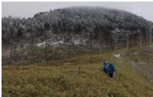
吹きさらしの笹の平