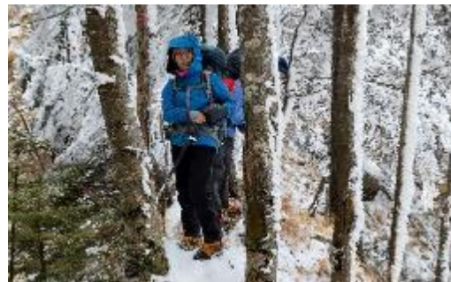
池口岳付近。雪山でした。

樹林に夕陽が差し込み、周りを金色に照らす。温かな光に包まれながら、先行する二人が進んでいく。同じ景色に自分もいる事がとても幸せに感じた。