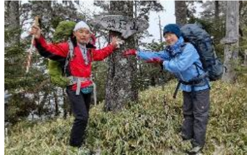
鶏冠山北峰 7:30 おはようございます！