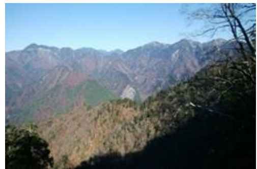
■前黒法師山の尾根からの眺め

黒法師岳への道はあいにくガスのため視界も悪い。霧に浮かぶ笹原をひたすら藪こぎして進む。途中には若干の霧雨もあり衣服調整が大変。特に黒法師直下の笹ヤブは背が高く、濡れた笹に急登が組み合わさり、とてもきつい。急斜面では笹原に潜り込み、笹の根元を掴んで登るといった感じであった。