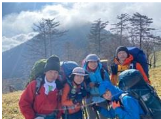
■等高尾根分岐から黒法師岳