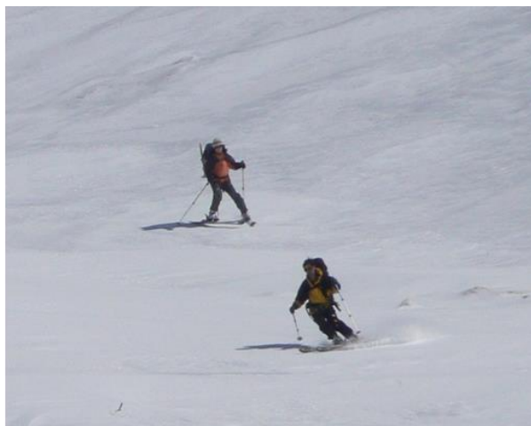
三俣蓮華への登り (バックは黒部五郎)

高校1年 山岳部に入部し、初めてのアルプスは新穂高～双六岳～槍ヶ岳に登り南岳から下山 大学では ワンゲル部に入部し、南ア 聖岳から北岳へ縦走 大学1年より山スキーを始める。野沢温泉にてスキーの技術を学ぶ 大学1年2月 乗鞍岳にて冬山研修会を受講 大学2年 北海道トムラウシから十勝岳へ縦走。下山後、ニペソツ、利尻岳、後方羊蹄山に登る。 大学3年 剣から阿曾原に降りて、祖母谷から白馬岳に登り、日本海に向けて縦走。 大学4年 針の木峠から黒部湖側に降りて、東ノ川をつめ、水晶岳から笠ヶ岳へ縦走。 23才の3月。北海道 ニセコ、十勝、大雪スキー場で北海道のスキーを楽しむ 27才の5月下旬。北海道 大雪山系、旭岳、十勝岳、旭岳、石狩岳、及び芦別岳の頂上から滑る。 40代半ば、比良雪稜会に入会し、同時に山スキーネットに入る。 50代初め、大阪の沢雪山歩に入会する。 仕事で出張中、東北の山々、谷川連峰、燧ヶ岳、平ヶ岳等を楽しむ。 今年、4月滋賀山友会に入会しました。