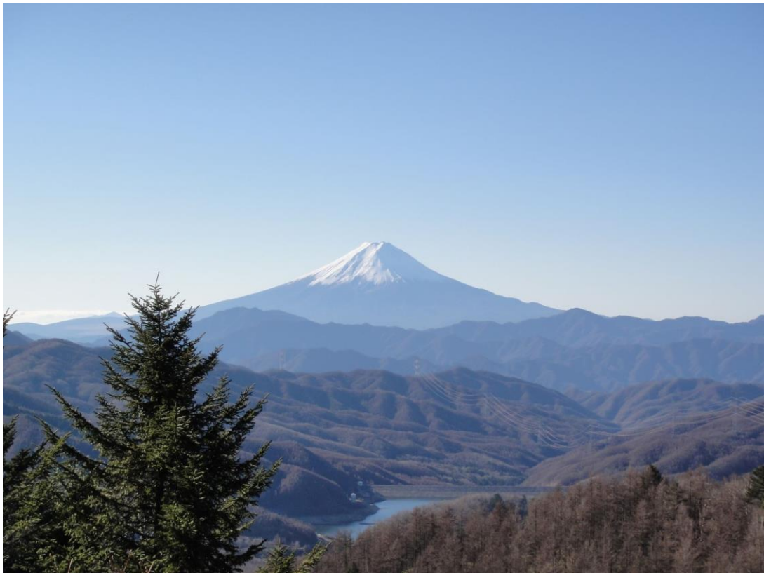
『大菩薩峠からの富士』