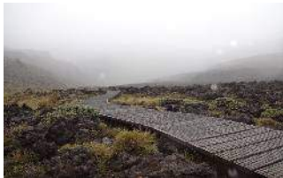
整備されたTongariro Alpine Crossing

2月11日(日) 6:30起床 Mt Ngauruhoe 2291 メートル 登山と決め8:30宿を出発 9:45スタート地点到着 終日雨 9:45出発10:50～11:00休憩 12:45引き返すRed Crater付近 スタート地点に16:00着