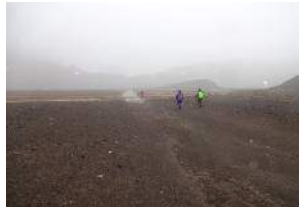
広大な火口に行く