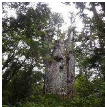
大木 Tane Mahuta

2月17日(土) カウリの巨木 観光 ホリデーパークスインニュージーランド 2連泊