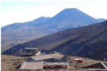
リフトとナウルホエ

2月15日(木) 6:30起床 ユース発8:20 Iwikau Village着9:00 準備を整え、リフトに乗り、9:45に歩き始め 9:45→10:54休憩11:02→1880 ↑ 地点11:10→12:15休憩2175 ↑ 付近12:23→13:14ピーク→ 13:25ドームピーク13:36→13:48再びピーク14:25→16:55リフトNo Entry→17:25駐車場 行動時間:8時間20分