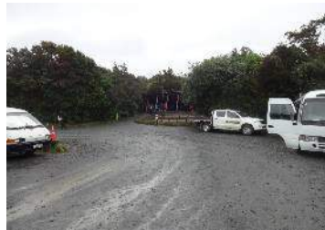
Ketetaha Finish (下山口)

2月11日(日) 6:30起床 Mt Ngauruhoe 2291 メートル 登山と決め8:30宿を出発 9:45スタート地点到着 終日雨 9:45出発10:50～11:00休憩 12:45引き返すRed Crater付近 スタート地点に16:00着