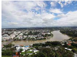
タズマン海とファンガヌイ川