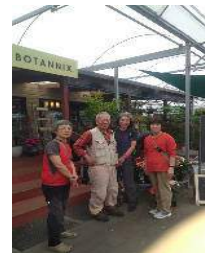
お茶をした園芸店