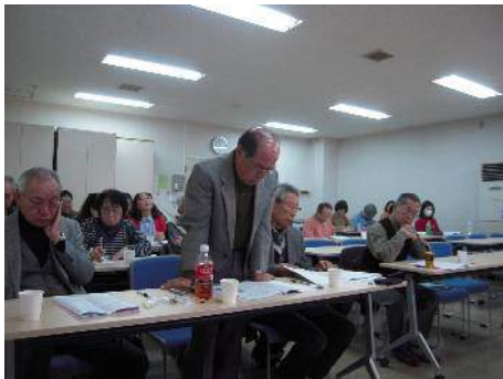
代議員による質問