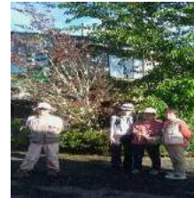
15日の朝 Hostel National Park

2月15日(木) 6:30起床 ユース発8:20 Iwikau Village着9:00 準備を整え、リフトに乗り、9:45に歩き始め 9:45→10:54休憩11:02→1880 ↑ 地点11:10→12:15休憩2175 ↑ 付近12:23→13:14ピーク→ 13:25ドームピーク13:36→13:48再びピーク14:25→16:55リフトNo Entry→17:25駐車場 行動時間:8時間20分