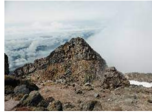
Mt.Taranaki 標識も道標もない

2月14日(水) WhanganuikからNational Park付近で泊、翌日Mt Ruapehu 2797 ↑ を目指す 晴れ・移動日