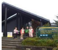
Tongarieo Visitor Centre