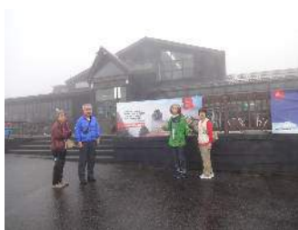
Whakapapa Skifield クローズ

2月12日(月) 5:00起床 移動日 4時間の時差に慣れてきた。7:30宿発 Whakapapa Skifieldを下見する 10:00 New Plymouthへ 途中崖崩れで迂回し、途中でお茶をし、16:00頃フラングモーテル着 タラナキ大聖堂、聖メアリー教会、マースランド・ヒルを観光しマーケットで食材を購入する