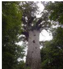
巨木 Te Matua Ngahere