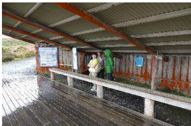
Tongariro Alpine Crossing スタート地点

2月10日(土) ロトルア(Rotorua)からトゥランギ(Turangi)へ移動 ジャッジスプールモーテル2連泊 雨とガスなので Mt Ngauruhos 2291 メートル の登山は諦め登山口の下見とする