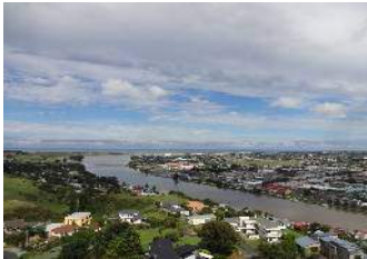
ワンガヌイの市街メモリアルタワーからの眺望

2月14日(水) WhanganuikからNational Park付近で泊、翌日Mt Ruapehu 2797 ↑ を目指す 晴れ・移動日