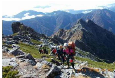
奥又白から前穂高岳へ