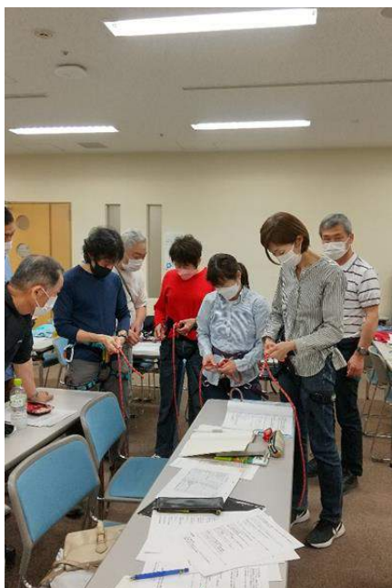
4/13 ロープワークの練習